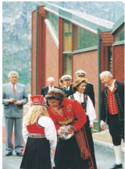
Då Dronning Sonja opna Hardangervidda Natursenter Eidfjord i 1995

har god von om at redaktøren av National Geographic kjem til konferansen og forklarar kvifor dei norske fjordane er reisemål nr. 1 i verda.