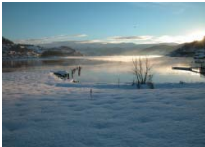
Vinter i Hardanger (Norheimsund)

Kommentar v/Cathrine Krane Hansen i BT 16.12.04